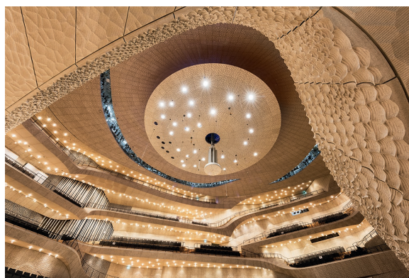
Rund 2800 Sonderleuchten von Zumtobel lassen die Elb-Philharmonie kunstvoll erstrahlen; Elbphilharmonie, Hamburg, Deutschland